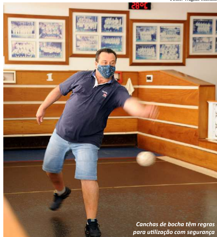
Canchas de bocha têm regras para utilização com segurança