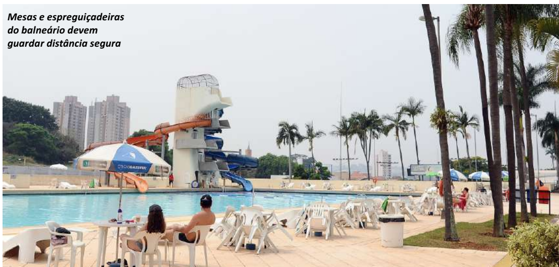
Mesas e espreguiçadeiras do balneário devem guardar distância segura