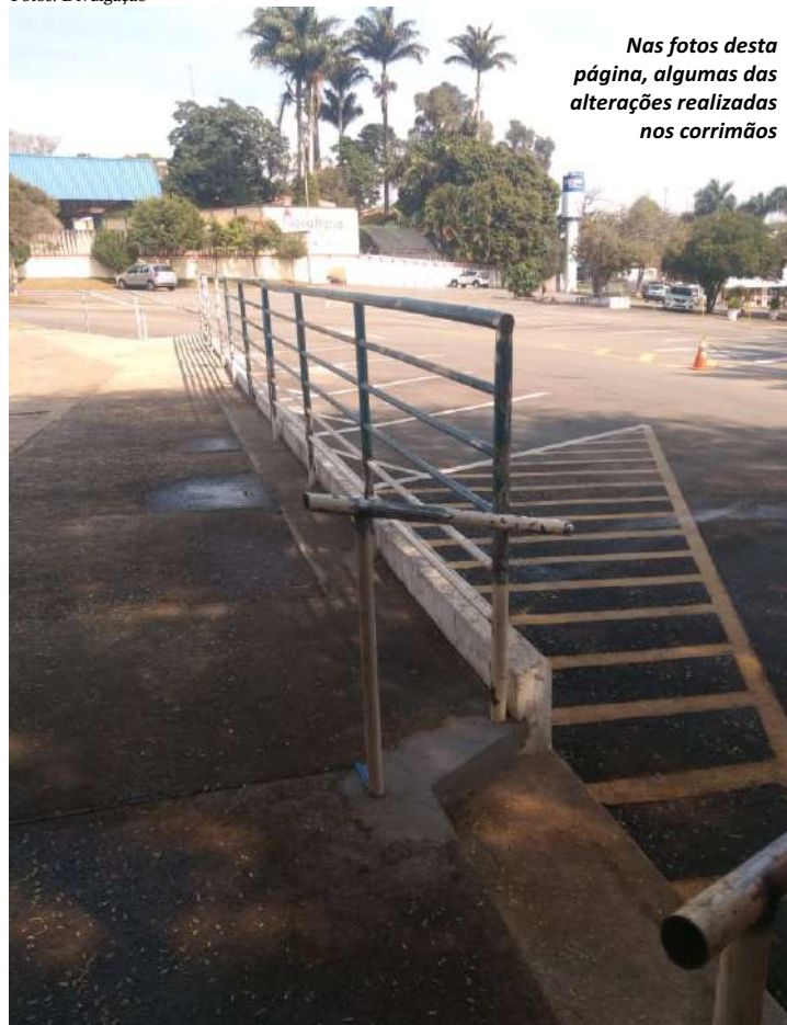
Nas fotos desta página, algumas das alterações realizadas nos corrimãos

O Nosso Clube vem realizando, nos últimos meses, uma série de adequações para atender às especificações contidas no Auto de Vistoria do Corpo de Bombeiros (AV-CB). Expedido pelo Corpo de Bombeiros da Polícia Militar do Estado de São Paulo, esse documento certifica que o local possui as condições necessárias de segurança contra incêndio e pânico. Trata-se de um conjunto de medidas estruturais, técnicas e organiza-